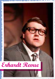
Heinz Erhardt Revue